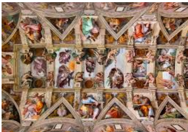
Michelangelo - A Sixtus-kápolna mennyezetfreskója

Én szeretni és adni akarok: Egy harmatcseppért is – tengereket. S most tengereket látok felém jönni, És nem maradt egy könnyem – megköszönni.