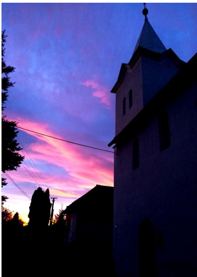
Református templom Péder - XIII. század

Református gyülekezeti kiadvány Péder – Jánok 2020 március-április