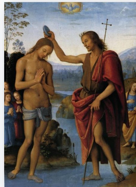
Pietro Perugino: A keresztelés után a Szentlélek Jézusra szállt galamb formájában

A Szentlélek másik nagy csodája az, hogy ennek a bűnbánatnak a nyomán felébred bennünk a változás utáni vágy. Akik Péter apostolt hallgatták, azok megkérdezték: Mit tegyünk? A Szentlélek által ébresztett bűnbánat ma is ezzel a kérdéssel folytatódik: Mit tegyek? Hogyan változhatok meg? Akiben ez a kérdés felébred, az biztos lehet abban, hogy a Szentlélek munkálkodik benne.