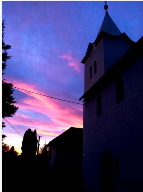
Református templom Péder – XIII. század

REFORMÁTUS GYÜLEKEZETI KIADVÁNY PÉDER-JÁNOK 2020 MÁJUS