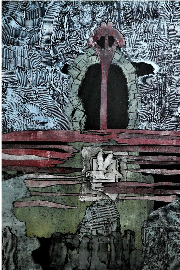
Mezei Erzsébet: Másik Világom 14