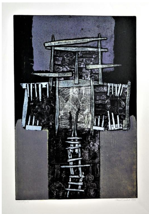
Mezei Erzsébet: Másik világom 3